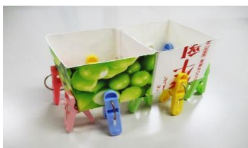
とことこ歩いてるみたい