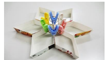
お花かな？ お星さまかも☆？